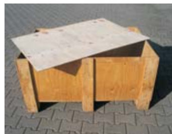
BV - bedna velká

rozměr: 80 x 60 x 60 cm EAN: 8595057688216