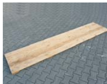
IP4 - dřevěný podklad

rozměr: 60 x 40 x 40 cm EAN: 8595057687745