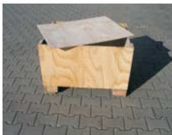
BS - bedna střední

rozměr: 52 x 30 x 30 cm EAN: 8595057688209