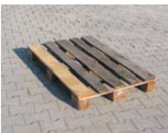
IP3-1 - paleta dřevěná EUR

rozměr: 120 x 80 x 60 cm EAN: 8595057687653