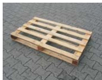
IP8 - paleta prostá