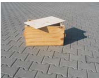
BM - bedna malá

rozměr: 52 x 30 x 30 cm EAN: 8595057688209