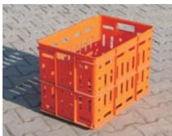
PR - přepravka 357-515

rozměr: 60 x 40 x 40 cm EAN: 8595057687745