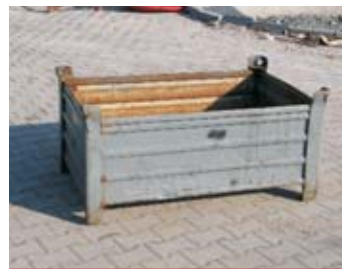
IP2 - bedna kovová

rozměr: 180 x 120 x 82 cm EAN: 8595057688230