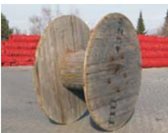
M6500 - buben M220

rozměr: 120 x 80 x 60 cm EAN: 8595057688223