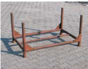
IP1 - paleta trubková

rozměr: 120 x 80 x 63 cm EAN: 8595057687660