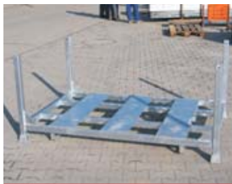
IP10 - paleta kovová

rozměr: 120 x 80 x 63 cm EAN: 8595057687660