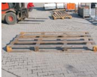
IP3-3 - paleta dřevěná